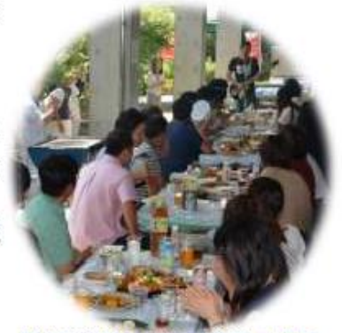
第1回農業理解活動事業の様子