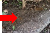
茶の根元にあげた穴の中に肥料を入れます。