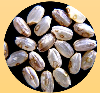
籾の放置による「むれ米」

また、収穫した籾も収穫後すぐに通風するなど、刈取ったまま放置しないように注意してください。放置すると気温が高いため、「むれ米」や「茶米」が発生し、品質が低下するおそれがあります。