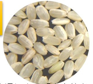
高温による「白未熟米」

本年も異常気象下で、気温が異常に高い日が続いております。 出穂期以降、登熟期に気温の高い状態が続くと、高温障害が発生する可能性があります。高温が続くことにより「白未熟粒」が増加しますので、高温障害を受けないように適切な管理に努めてください。