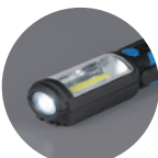
懐中電灯機能 (LED 1灯)