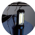
ポールフックで クローゼットに