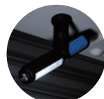
用途が広がる マグネット付き