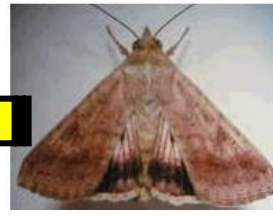
成熟まで約 23 日 (年間世代数は 4~5 世代)

1 頭の幼虫で、複数の果実・花蕾を食害し渡り歩くので、見つけたら捕殺しましょう。単純ですが、非常に効果的です。