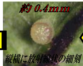
約 0.4mm 縦横に放射線状の細刻 約 2.5 日で孵化 (約 30℃) ヨトウガ等とは違い、1 個ずつ産卵します。