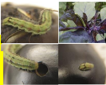
幼虫の期間は、約 10 日間

コアオカスミカメに、成長点部が吸汁加害にあうと、成長と共に被害部が拡大するので、葉に多数の穴が開いたり奇形になったりします。被害が激化すると芯止まりになり、その後の成長や収穫量に多大な影響を与えます。