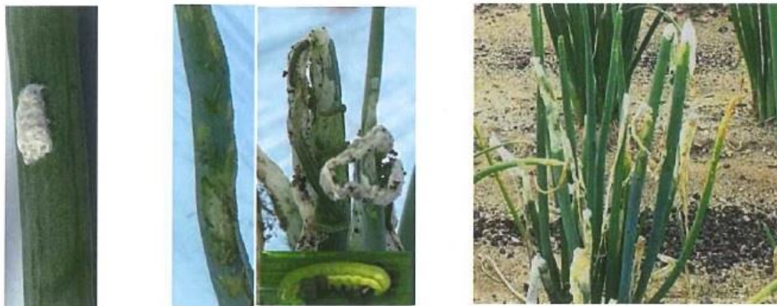
写真 ネギでのシロイチモジヨトウの卵塊(左) 幼虫(中)、被害株(右)