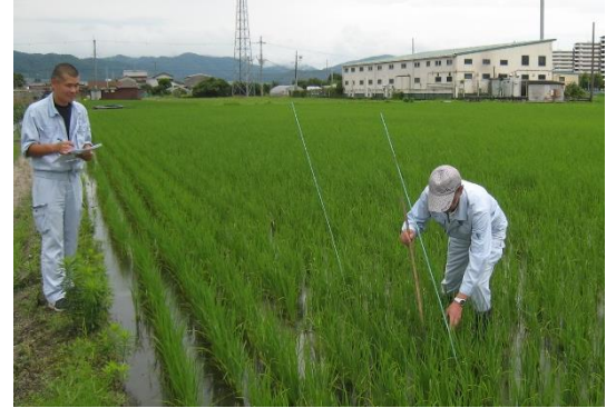
施肥合理化展示圃の生育調査

本年の水稲の植付けは早いところで4月末から始まり、6月中旬を以ってほぼ終了しました。気象状況は5月から6月にかけて高温で推移し、一部でガス発生や除草剤薬害の圃場がありました。全体的には生育がやや早めで、ほぼ順調に生育しています。