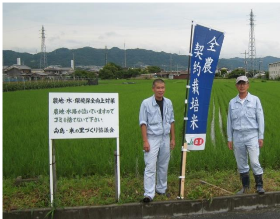
多収性品種「ほしじるし」の実証圃場

向こう一か月予報によると今後の気温は並から高いとされています。有効茎数を確保でき次第、中干しを開始することが必要です。ただ過度の中干しは田面の亀裂による断根や湛水機能の低下を招くので避けてください。また、病害虫発生予報ではウンカ、ツマグロヨコバイ、カメムシ等の害虫の発生が多いと予想されていますので、適期防除に留意しましょう。もちろん自分自身の熱中症にもくれぐれもご注意を！