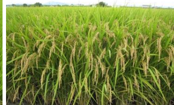
R3 一等米づくり実証圃場の概要