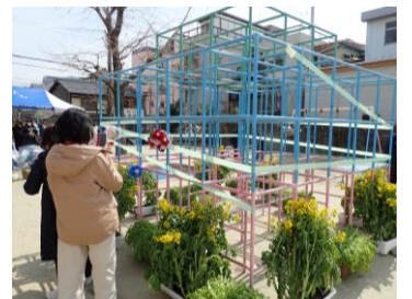
イベント会場での展示の様子