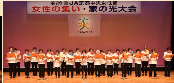
サークル発表、海印寺支部