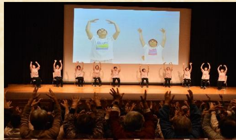
サークル発表、向島支部