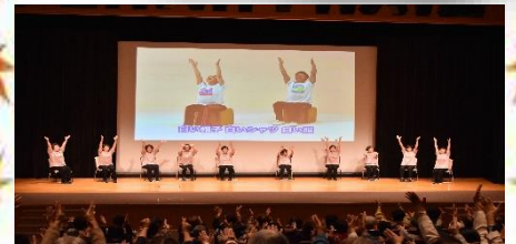
家の光大会でレインボー体操を発表

向島支店女性部は今年度役員改選があり新たな顔ぶれでスタート。部員みんなが参加したくなるような行事を考えています。