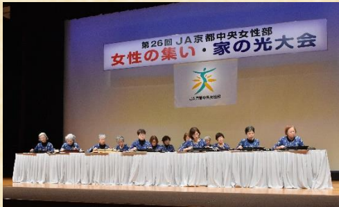
サークル発表、淀支部