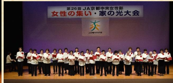
サークル発表、岩倉支部