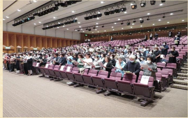
全員で「明日輝くために」斉唱