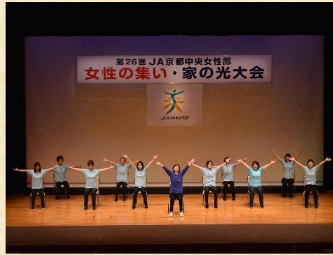
サークル発表、洛南支部