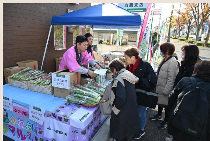
※画像は 2025 年 11 月 21 日に開催されたものです