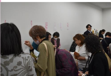
毎回好評の物品販売