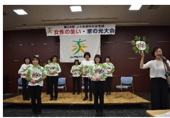
乙訓「ホリホリ体操」