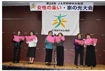
海印寺「カラオケ発表」