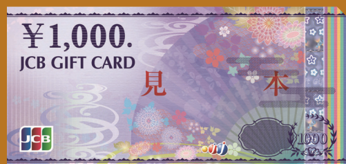
※景品をお渡しするまでにお時間がかかることがあります。 ※絵柄はイメージです。

ご家族・ご友人をご紹介ください！ JA年金友の会ご紹介特典 ご紹介によりご家族・ご友人が当JAで年金をお受取りいただくと、双方に 1,000円分の JCBギフトカード をプレゼント！