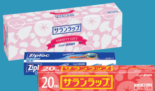
※プレゼントは対象期間内にお一人様1回限りとなります。

ご家族・ご友人をご紹介ください！ JA年金友の会ご紹介特典 ご紹介によりご家族・ご友人が当JAで年金をお受取りいただくと、双方に 1,000円分の JCBギフトカード をプレゼント！